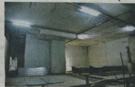
स्कायवॉक मार्गे सांताक्रुझ रेल्वेस्थानकाशी जोडणी