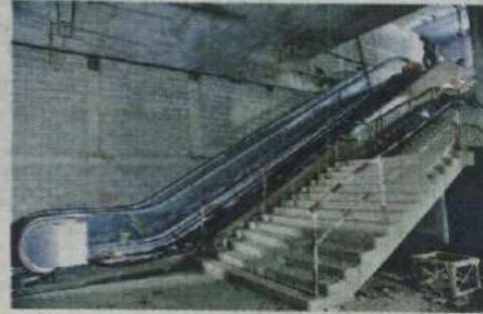
सांताक्रुझ स्थानकाचे ८४ टक्के काम पूर्ण