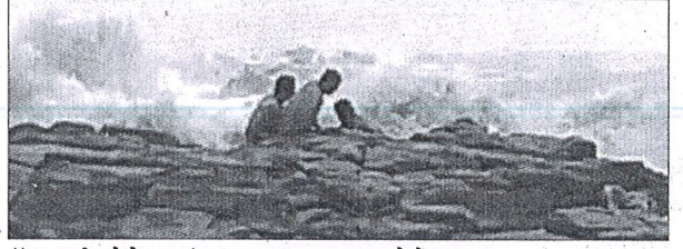
रॉक गार्डन येथे लाटांच्या तडाख्यात सापडलेले युवक

सध्या समुद्र खवळला आहे. जोरदार लाटा किनारपट्टीवर धडकत आहेत. रॉक गार्डन परिसरात या लाटा अधिकच उसळत आहेत. अनेक पर्यटक व नागरिक या लाटांचा आनंद